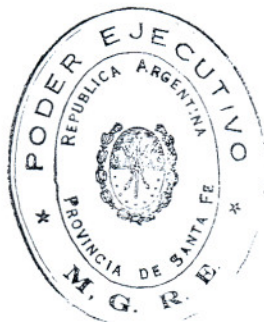
HERMES JUAN BINNER GOBERNADOR DE SANTA FE